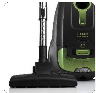
Combi brush parquet and carpet Escova combi parquet e carpete Cepillo combi para madera y alfombra Brosse combi plancher et tapis