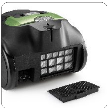
HEPA filter (High efficiency) Filtro HEPA (Alta eficiência) Filtro HEPA (Alta eficiencia) Filtre HEPA (Haute efficacité)

Power: 700 Watts - 230V~50Hz Potência: 700 Watts - 230V~50Hz Potencia: 700 Watts - 230V~50Hz Puissance: 700 Watts - 230V~50Hz