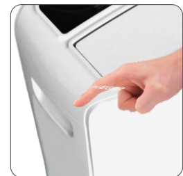
Carrying handle Pega de transporte Asa de transporte Poignée de transport