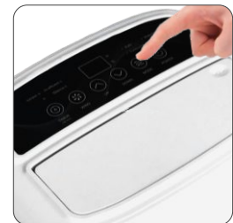
Electronic control with LED display Controlo electrónico com ecrã LED Control electrónico con pantalla LED Contrôle électronique avec écran LED

Potência: 255 Watts - 220-240V~ 50Hz Potencia: 255 Watts - 220-240V~ 50Hz Puissance: 255 Watts - 220-240V~ 50Hz