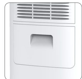
Tank capacity: 2 Liters Capacidade do depósito: 2 Litros Capacidad del depósito: 2 Litros Capacité du réservoir: 2 Litres